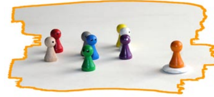
Variante 1: Arbeit mit Stellvertretern (= Klient + Mitsteller + Berater)

Systemische Aufstellungen – Was ist das und wie funktioniert das?