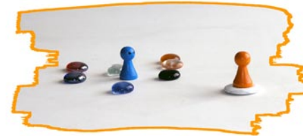
Variante 2: Einzelarbeit (= Klient + Berater)