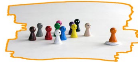
Variante 3: Gruppenarbeit (= Gruppe + Berater)